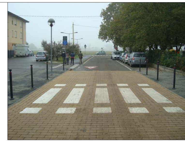
ESEMPI DI PLATEE E ATTRAVERSAMENTI RIALZATI REALIZZATI A REGGIO EMILIA